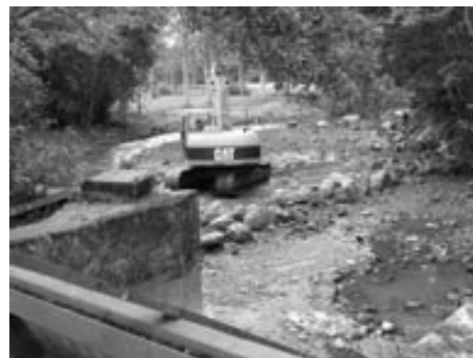
Opération d'arasement en cours, le 5 juillet 2011

L'effacement de ce barrage, qui n'avait plus aucune utilité fonctionnelle depuis l'arrêt du comptage de poissons migrateurs fin 2008, était devenu prioritaire suite au Grenelle de l'Environnement, tant son impact sur la libre circulation des sédiments et des espèces était conséquent à l'échelle de la Rouvre...sans compter le fait que le colmatage des fonds qu'il induisait sur plusieurs centaines de mètres en amont était défavorable à de nombreuses formes de vie, dont la moule perlière.