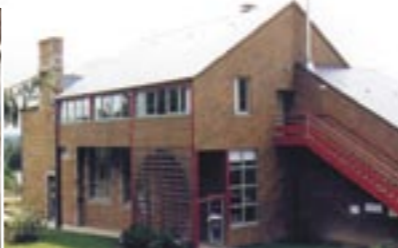
Le gîte de Bréel