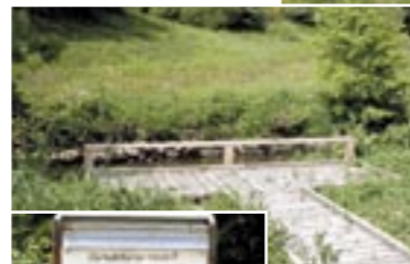
Platelage en bois rainuré, au travers des prairies humides