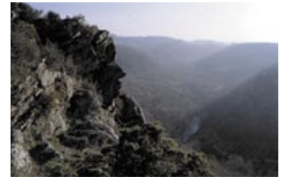
La Roche d'Oêtre