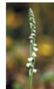
Spiranthe d'automne, Cordulégastre annelé et Mélite à feuilles de mélisse