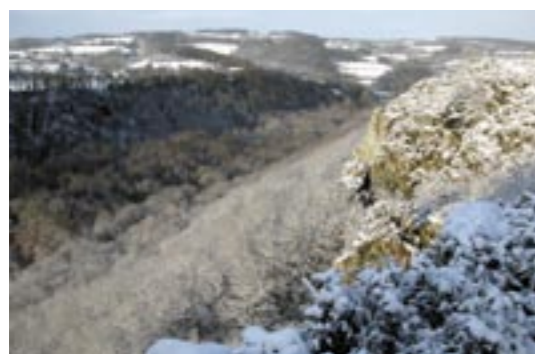
Les gorges de la Rouvre en hiver

Le parcours «pêche-nature» est situé à l'amont du secteur. Il s'agit, en rive droite de la Rouvre et sur la commune de Bréel, d'un ensemble de 10 hectares rassemblés autour de la Maison du Paysage gérée par le CPIE des Collines Normandes.