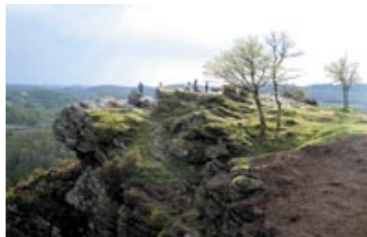
Le belvédère de la Roche d'Oëtre

Inscrite depuis des décennies au Guide Michelin, la Roche d'Oëtre reçoit de nombreux visiteurs de France et de l'étranger. Cet abrupt naturel de 117 mètres est d'ailleurs présenté dans le cadre de la Charte Paysagère (1998) comme un «point d'ancrage» pour la découverte touristique de la Suisse-Normande, accompagné par «quatre points d'accroche» : le Mont de Ségrie-Fontaine, la Maison de la Rivière, Rouvrou et Bréel.