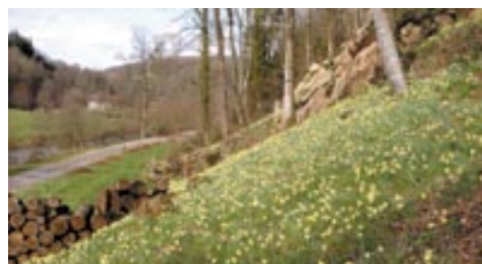
Le site de la Maison du Paysage au printemps

Outre la Maison du Paysage qui permet déjà l'accueil des visiteurs et des scolaires, la Maison de la Rivière, située à 500 mètres, complète le dispositif avec, entre autres, sa station de comptage des poissons migrateurs (Anguille, Saumon...) et son exposition permanente gratuite sur le thème de la pêche et de la gestion des cours d'eau.