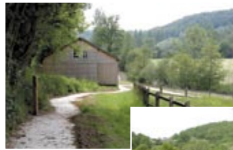
Sentier stabilisé, avec une pente à moins de 5 %, au travers de prairies sèches, bois et bocage