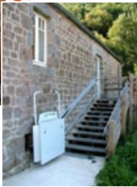
La plate-forme motorisée

Pour assurer à l'ensemble du public l'accès au parcours «pêche-nature», les travaux ont consisté en :