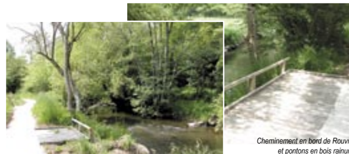
Cheminement en bord de Rouvre et pontons en bois rainuré