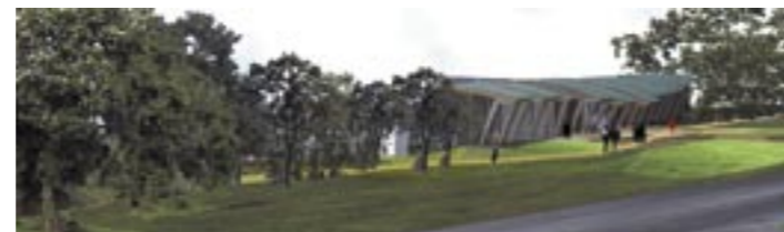
Projection du pavillon d'accueil de la Roche d'Oëtre

Enfin, la Communauté de Communes d'Athis s'est également engagée dans la création de structures d'hébergement de groupe, avec la création de deux gîtes intercommunaux , l'un à l'amont, à Bréel (800 mètres du site) et habilité tout public, l'autre à l'aval, à St-Philbert (gîte de plain pied à proximité de la Roche d'Oëtre).