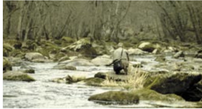
Pêcheur dans les gorges de la Rouvre

Après appel d'offre à entreprise, les travaux, débutés fin 2003, ont été réalisés par l' entreprise Minéral Service (Rouen).