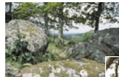
Boules de granite

Le caractère paysager du secteur choisi pour le parcours «pêche-nature» est particulièrement original : il s'agit de paysages du «granite» , avec toutes les formes typiques induites par la nature de cette roche : vallée déjà encaissée au pont de Ségrie-Fontaine qui se resserre vers l'aval en des gorges pittoresques menant à Oëtre ; cours d'eau torrentueux qui coule entre d'énormes blocs et des bancs de sable ; prairies souvent pentues d'où émergent des boules de granite ; chemins creux et murets de pierre sèche ; bocage avec bâti traditionnel ancien et de qualité (Bréel).