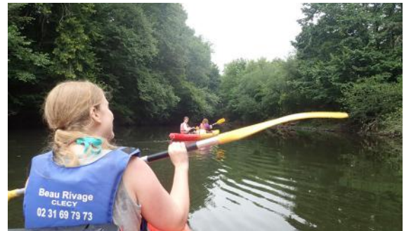
L'équipe a embarqué en canoë pour inventorier les exuvies de libellules.

Ces suivis scientifiques ont été lancés dès 2019 pour évaluer l'effet du retrait de ces ouvrages sur les populations de libellules.