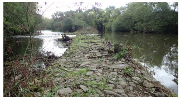
Les prospections se sont concentrées en amont et en aval de barrages qui seront supprimés en 2020.