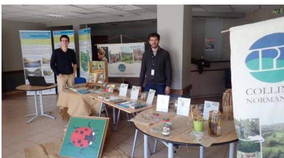
Nous y étions ! - Stand et exposition dédiés au réseau «Suisse normande, territoire préservé» et à la démarche Natura 2000. Au programme conférences et randonnée nature.

L'événement s'est déroulé les 6 et 7 avril dernier à Clécy ! Organisé par Suisse Normande Tourisme, cette manifestation vise à valoriser notre joli territoire, riche en animations et en activités nature pour petits et grands.