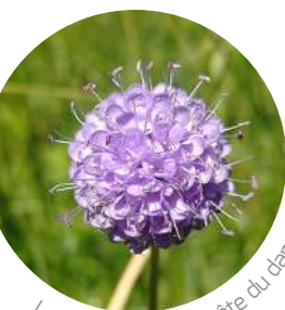
La succise, plante hôte du damier

Le damier de la succise ( Euphydryas aurinia ) vit dans les prairies humides ou les pelouses calcaires.