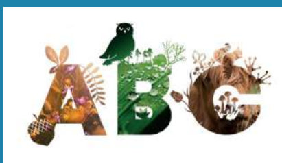
Logo réalisé par la ville d'Argentan

Un ABC est un outil qui permet d' agir contre l'érosion de la biodiversité . Après un inventaire qui sera réalisé au cours de l'année et de nombreuses animations sur ce thème, un comité technique, constitué notamment d'habitants, aura pour mission de proposer des actions répondant aux enjeux identifiés.